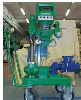
Установка для заполнения бочек без шланга.