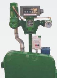
Насосно-измерительная установка с механическим счетным устройством