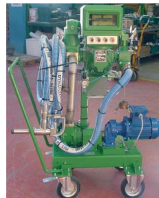
Установка для заполнения бочек растворителями