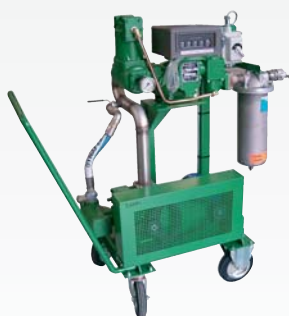
Насосно-измерительная установка на тележке