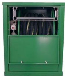
Большой барабан в корпусе