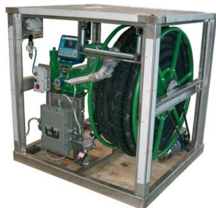
МА500-SGK с электронным счетным устройством