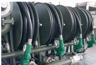
Барабаны с раздаточными пистолетами