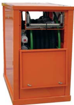
Малый барабан в корпусе