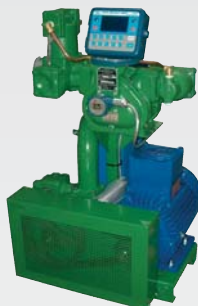
Насосно-измерительная установка с электронным счетным устройством LCR – TE550