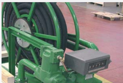
Барабан с счетчиком и механическим счетным устройством