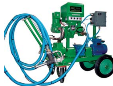
Установка для заполнения бочек.