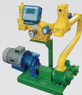
Насосно-измерительная установка с электронным счетным устройством LCR – TE550 и ультразвуковым детектором воздуха LCSound